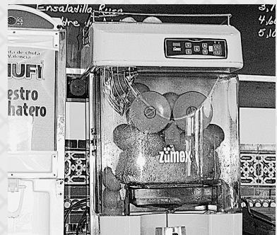
バルのオレンジ絞り機

バレンシアもまたバイリンガルの地域ですが、バレンシア語が話されます。バレンシア語とカタルーニャ語は、同じ言語の方言というのが定説です。