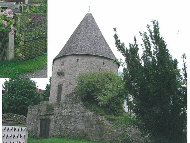
ホルンを囲む壁と塔