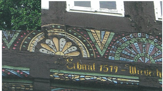
上の家の模様を拡大したもの、1579年築と表示されている