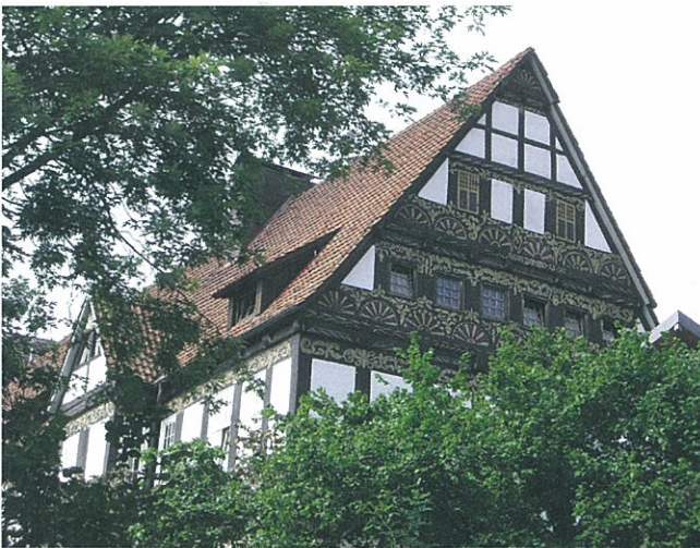
ホルンの古い民家、魔女狩りが起こった頃の建物