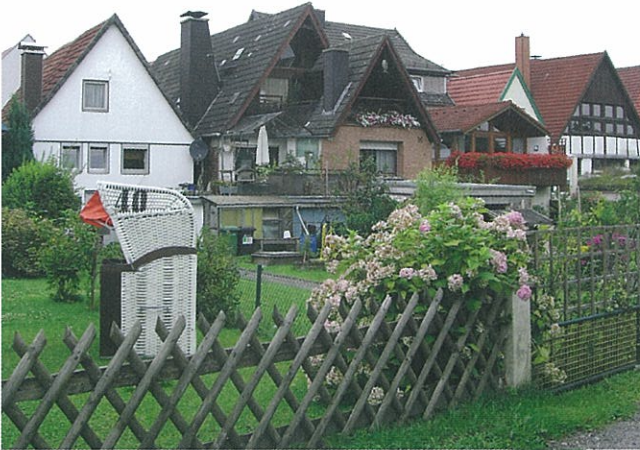
ホルンの市壁付近の家と裏庭