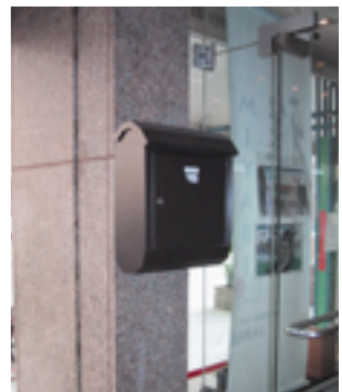
ドイツで見られる郵便受け▶ 鍵がついています。